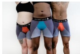
Menstruatieondergoed (Pyramid seven)