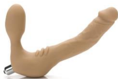
Strapless dildo met vibrerende kogel (Realdoe Tantus)

De meeste penisprotheses houd je op hun plaats met een speciaal daartoe ontworpen harnas of onderbroek/boxershirt met extra ruimte of stoffen/elastic haakje. Er bestaan ook penisprotheses die je d.m.v. speciale lijm aan je lichaam kan vastmaken. Voor sommige modellen heb je geen houder nodig, enkel een strakke onderbroek. Als je geen nieuwe onderbroeken wil kopen, kan je ook zelf met naad en draad aan de slag gaan. Sinds kort kan je zelfs je ondergoed opsturen naar iemand van Made By Me, een Belgisch naai- en stik DIY initiatief ( hier terug te vinden op Facebook). Zij doen de nodige aanpassingen, et voilà jouw onderbroek of boxer is packerproof!