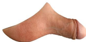
STP (Emisil compact)