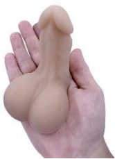
Packer (Mr. Limpy small)

Daarnaast bestaan er ook 3in1 modellen waarmee je zowel broekvulling hebt, staand kan plassen én kan penetreren. Vaak wordt hiervoor gebruik gemaakt van een buigzame erectiestaaf of erection rod die je dan in je penisprothese kunt schuiven zodat deze recht blijft staan. Uit ervaring blijkt dat deze erectiestaven niet altijd even stevig zijn en alsnog ombuigen of een ongewenst piepend geluid maken tijdens de seks. Iets om mee rekening te houden dus.