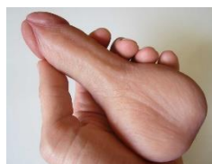
STP (EZP Transthetics)