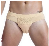
Vulva slip met camel toe

Houd er rekening mee dat je erg kan gaan zweten in zo'n vulvaprothese en dit dus snel voor infecties of een schurend gevoel kan zorgen. Niet alle materialen zijn even lichaamsveilig of/en ademend, probeer dit dus goed uit te zoeken vooraleer je aankoopt. Daarnaast heb je ook voorgevormde slips of/en inserts in de vorm van een vulva met schaamlippen. Het creëert dus als ware een soort "camel toe" vooraan in je slip. Sommige trans personen vinden het fijn, anderen vinden dan weer dat het net nog meer de aandacht vestigt op de penis doordat je nog een extra bult creëert. Het is eveneens belangrijk om jouw penisprothese goed te onderhouden. Je wast ze best regelmatig met handwarm water (en milde zeep of toycleaner). Je kijkt/vraagt verder best even na of de penisprothese neutraal verpakt wordt, wanneer je niet wil dat anderen te weten komen wat je kocht. De meeste webshops houden hier standaard rekening mee.