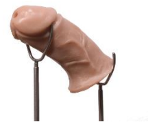
Meta extension (Banana Prosthetics)