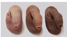
Packer (soft packer Your Rules)