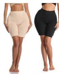
Heup en achterwerk pads