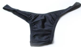
Gaff (Hiden candy boutique)