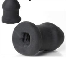
Masturbatie speeltje (Buck off sleeve)

De meeste trans personen met een meta kunnen noch rechtopstaand plassen, noch penetreren. De bovengenoemde penisprotheses bieden een oplossing hiervoor. Je kan hiervoor een meta extension aankopen die jouw meta verlengt. Er bestaan een aantal penisprotheses waar een (geribbelde) ruimte is voor jouw meta-penis zodat je een zuigend vacuüm effect krijgt dat voor extra stimulatie zorgt tijdens (solo-) seks. Ook zijn er vibrerende penisprotheses (bv. The Joystick; vroeger The Bono) die fijn aanvoelen op jouw meta/gegroeide clitoris. Daarnaast vind je heel wat solo trans specifieke masturbatie speeltjes terug zoals de Buck Off sleeve. Tot slot heb je nog clitorisstimulators (bv. Womanizer of satisfyer) die fijn kunnen zijn voor trans personen die een (gegroeide) clitoris hebben.