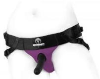
Harnas met dildo (Joque Spareparts)