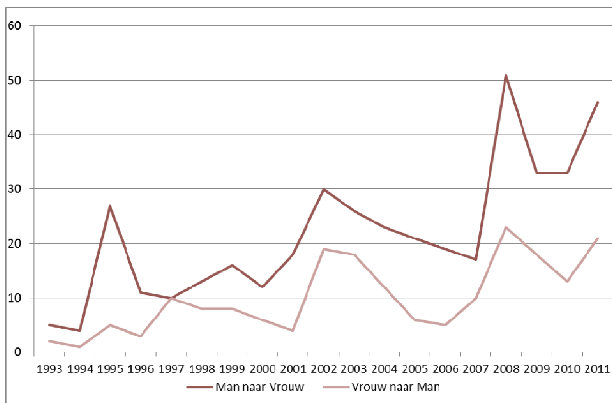
Grafiek 1: Evolutie in het aantal officiële geslachtswijzigingen sinds 1993

Gemiddeld waren er voor de periode 2002-2012 jaarlijks 31 mannen en 14 vrouwen die hun geslacht officieel lieten aanpassen.