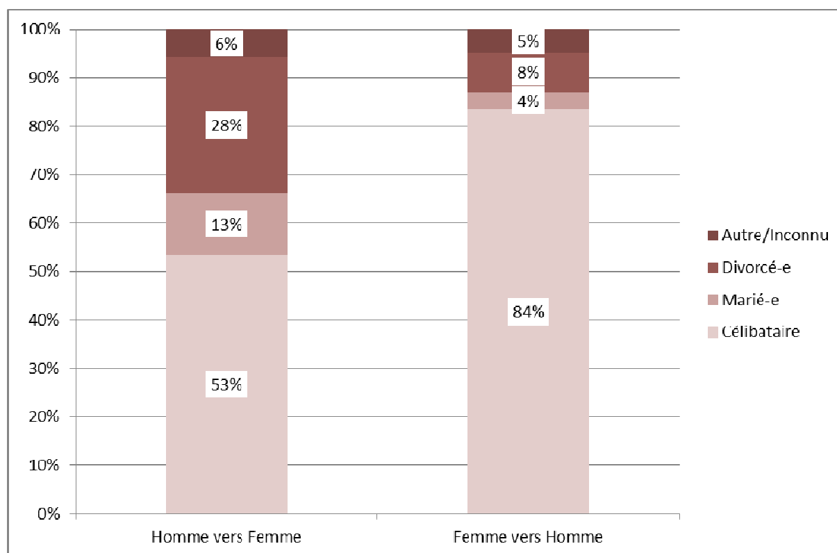
Graphique 3: État civil lors du changement de sexe officiel (1993 - juin 2012)